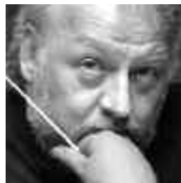
Heinrich Schiff © Basta