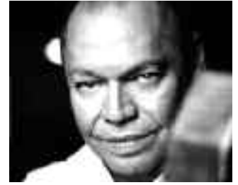
Thomas Quasthoff