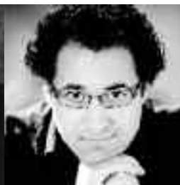
Leo Hussain © Borggreve