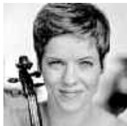
Isabelle Faust