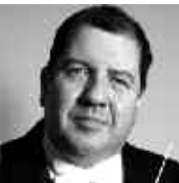
Ivor Bolton