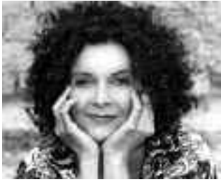
Angelika Kirchschräger