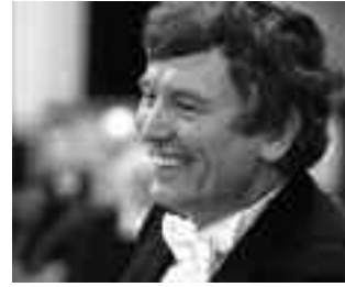
Michael Schönwandt

Die Reihe Sonntagsmatinee n ist eine Eigenveranstaltung des Mozarteumorchesters Salzburg und findet im Großen Festspielhaus statt. Preise II