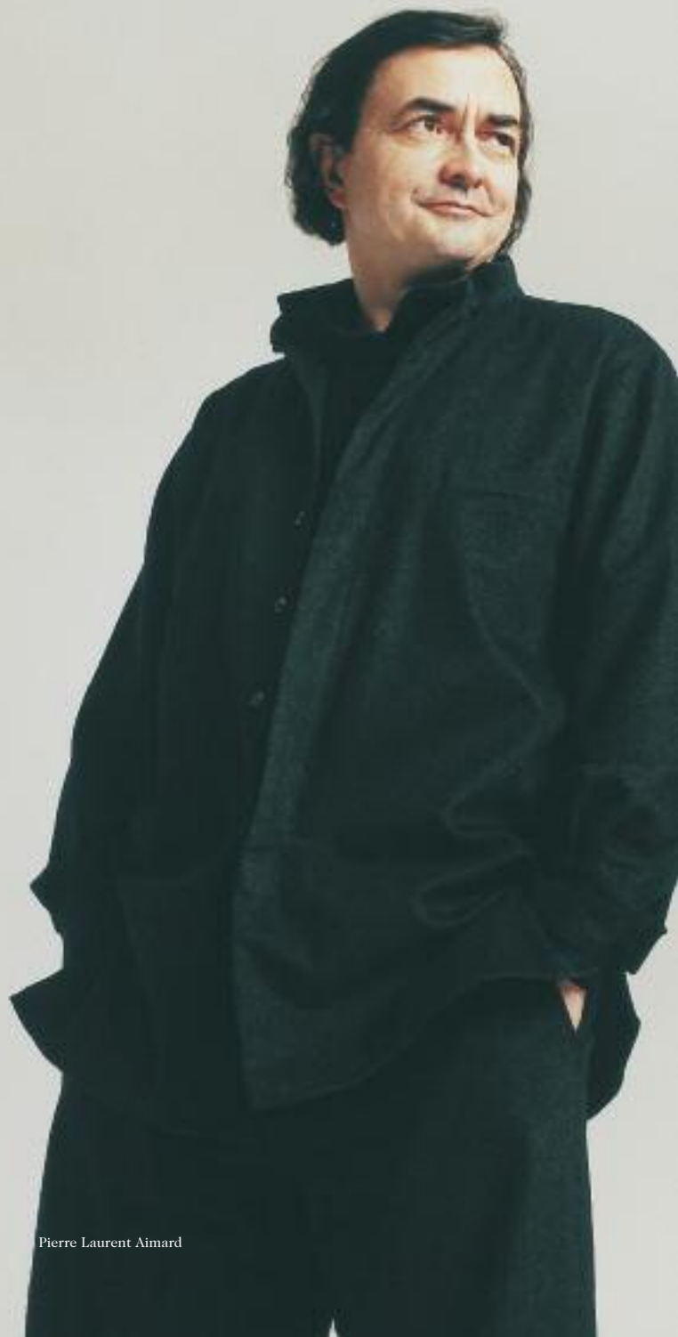
Pierre Laurent Aimard