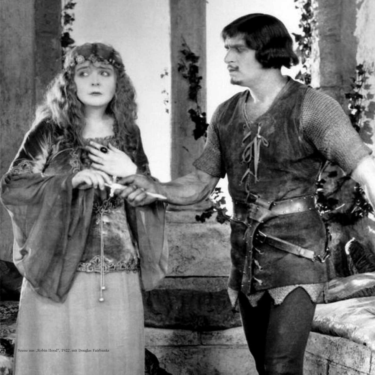
Szene aus „Robin Hood“, 1922, mit Douglas Fairbanks